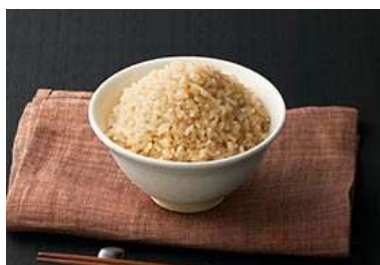
玄米のご飯 (T-fal 炊飯器広告)

おなか周りに脂肪が付き体重が増える、スリムな体形でいたいとなると敵は炭水化物で、ご飯や麺類を抑えなくてははいけません。血糖値も怖い。炭水化物は悪者ですが、「難消化性でんぷん」は体重を管理し、特定の病気の予防に役立つ炭水化物です。肥満の人が難消化性でんぷんを8週間摂取した結果、腸内微生物バランスが良くなり、インスリンの効きを改善し、脂肪の吸収を抑えて体重減少に至ったという学術誌の報告もあります。難消化性でんぷんが体にいい理由は、胃・小腸で分解できず通過し大腸に達しここでビフィズス菌など腸内細菌の餌になって発酵されることです。そこで出来る酪酸などが血糖の調整や、コレステロール値、免疫機能に良い影響があります。普通のでんぷんの6割しかカロリーがないので減量には好都合です。近年「レジスタントスターチ」などと横文字の名前の商品が出ていますが慌てる必要はありません。難消化性でんぷんは全粒粉、玄米、豆類に含まれますが、炊いて冷ましたポテトサラダなどもお勧めです。